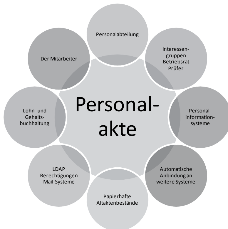
Rahmenbedingungen zur Personalakte

Die speziell entwickelte, zertifizierte Speicherhardware, die Sie zusammen mit der Softwarekomponente d.velop Personalakte erhalten, sorgt für die Langzeitverfügbarkeit der Daten und ermöglicht Ihnen die gesetzeskonforme Ablage Ihrer Informationen.